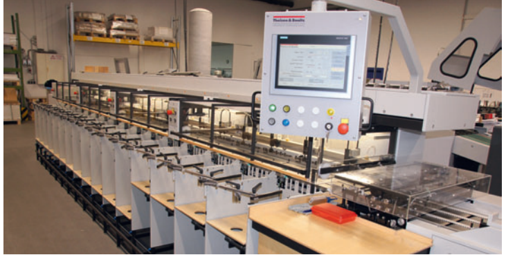
Die Zusammentragmaschine tb flex B 316 SP von Theisen & Bonitz erreicht bei Nino Druck dank der integrierten Wegoptimierung bis zu 4.200 Takte/h.