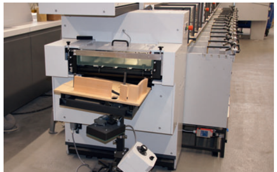
Zwei Produktionsmöglichkeiten: Mit Rechtslauf in die Broschürenfertigung – mit Linkslauf in den Auslage-Schüttler.