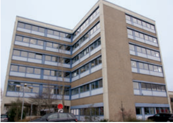
Die Nino Druck GmbH in Neustadt/Weinstraße, im Altenschemel 21.