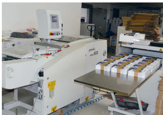
Die Auslage delta 502 von palamides bringt gestapelte und banderolierte Endprodukte auf den Puffertisch.