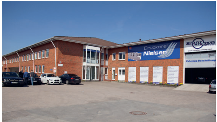
1.400 m 2 Platz bietet das 2010 bezogene Gebäude der Druckerei Nielsen in der Behmstraße in Flensburg.

Druckerei Nielsen Tel. 04 61 / 9 99 39 39 Theisen & Bonitz www.theisen-bonitz.de