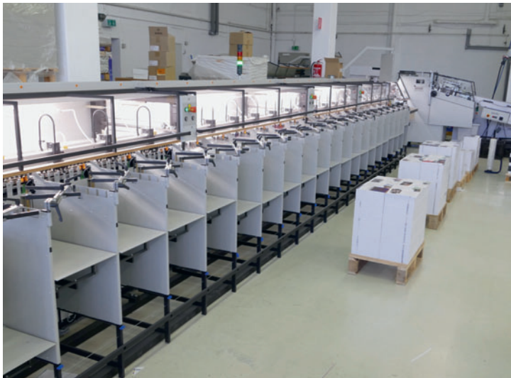
Die Zusammentrag-Maschine tb flex B 321 SP 4336 mit 21 Stationen und Sensorstapel bis 55 cm ist bei Nielsen bereits die dritte von Theisen & Bonitz.

Durch die letzten Investitionen, die allesamt von der Vorstufe über den Druck bis hin zur Druck-