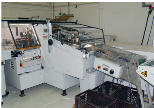
Die Heft-Falz-Schneid-Maschine tb 304 QSM 7214 leistet format- und papierabhängig bis zu 4.500 Takte/h.

Hohe Qualität, ein ökologisches Bewusstsein sowie reichlich Know-how und Individualität in der Beratung haben den Kun-