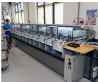
Seit 2016 sorgt die Zusammentragmaschine tb sprint B 315 VP für eine stopperfreie Produktion.

Das neue Aggregat konnte vom KVJS Baden-Württemberg bezuschusst werden und wurde im Februar 2019 von Theisen & Bonitz-Technikern installiert. Für die Einbringung, aber auch den Abtransport der alten Maschine, sorgte die Heidelberger Fach-