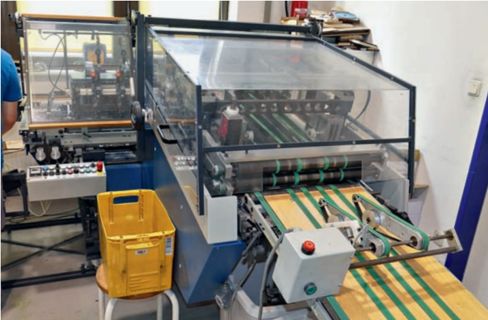
Das neue tb sprint 304 QSM Heft-Falz-Schneid-Aggregat von Theisen & Bonitz besitzt eine Zähl- und Separiereinrichtung sowie einen Dreischneider.

Die Texdat-Service gGmbH ist eine gemeinnützige Integrationsfirma mit dem einzigen Zweck, Menschen mit Behinderungen durch einen Arbeitsplatz die soziale und wirtschaftliche Grundlage für ein selbstbestimmtes Leben zu bieten.