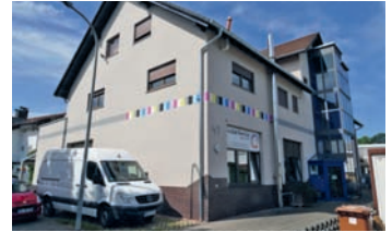
In der Mierendorffstraße in Weinheim befindet sich die behindertengerecht ausgestattete Druckerei Texdat-Service. Ein extra angebauter Aufzug verbindet die Texdat-Produktion mit den Wohnräumen unter dem Dach.

für einen Technologiesprung. Durch die Anwendung prozessloser CtP-Thermalplatten mit einem neu erworbenen Heidelberg Suprasetter steht man seit 2016 für noch bessere Qualität und Umweltverantwortlichkeit.