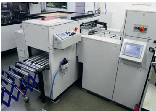
Im Linkslauf endet die tb flex in der tb-Stapelauslage, wo Sätze gezählt und zu Stapeln bis zu einer Höhe von 15 cm gesammelt werden und als Normal- oder Versetzt-Auslage aufs Band geraten. Im Rechtslauf endet das Zusammen-tragen in der Broschürenfertigung tb B 304 QSM, wo unter anderem der Drei-Seiten-Beschnitt vorgenommen wird.

2018 war für Blömeke ein wirtschaftlich gutes Jahr, was dazu führte, dass das Unternehmen 2019 in eine zusätzliche Fünf-farben-Offsetdruckmaschine mit Lackwerk im Mittelformat investieren konnte. Des Weiteren