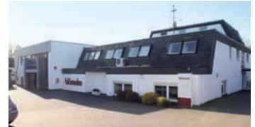
Blömeke in der Resser Straße in Herne beschäftigt 40 Mitarbeiter und gilt als Technik-Pionier. Bereits vor 17 Jahren eröffnete man den ersten Web-to-Print-Shop.

Dienstleistungen, wie etwa Design, Lagerung und weltweite Logistikkdienste sowie das Programmieren von Shopsystemen oder das Einrichten von Bezahl-Schnittstellen etc. Seit jeher zeichnet sich das Unternehmen dadurch aus, dass es technologische Neuerungen verfolgt sowie frühzeitig adap-