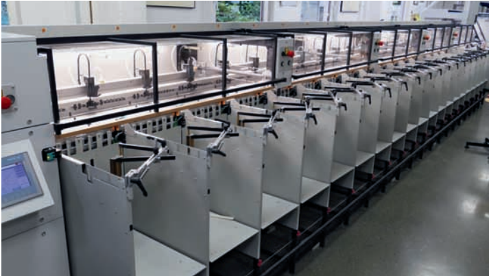
Mit 20 Stationen leistet die tb flex B 320 SP von Theisen & Bonitz bis zu 5.000 Takte pro Stunde und bietet eine automatische Formateinstellung.