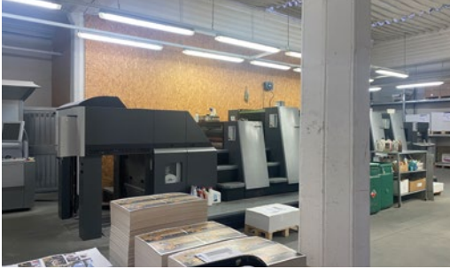
Einblick in den Drucksaal bei Medus. Hier steht eine Heidelberg Speedmaster XL im Zentrum.